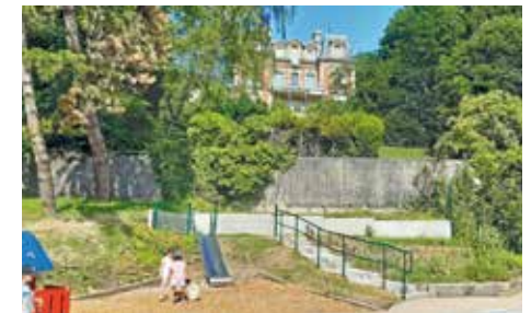
Cours d'école végétalisée et désimperméabilisée à Saint-Cloud (92)