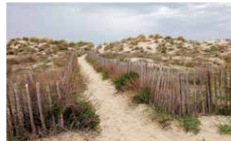
Reconstitution d'un cordon dunaire à Carnon Maugio (34)