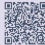
Le Centre de ressources pour l'adaptation au changement climatique

www.adaptation-changement-climatique.gouv.fr