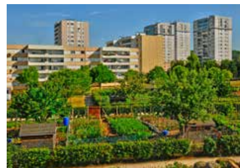
Jardins partagés aux Mureaux (78)