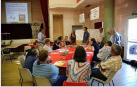
Atelier participatif animé par le Cerema

→ Si améliorer la résilience d'un territoire face aux effets du changement climatique relève de la responsabilité de la collectivité, elle concerne également l'ensemble des acteurs du territoire (associations, entreprises, citoyens, etc.). Les sensibiliser, les associer et les mobiliser se révèle donc indispensable.