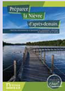
Accompagné par le Cerema, le Département de la Nièvre a élaboré sa stratégie d'adaptation en 2019

→ S'appuyant sur le diagnostic, la stratégie d'adaptation met en lumière les points les plus sensibles pour le territoire. Elle identifie les leviers d'actions les plus pertinents et les met en cohérence. Elle doit aussi intégrer les actions déjà en cours , soit pour les renforcer, soit pour les infléchir. Ainsi, la stratégie dessine la trajectoire d'adaptation particulière pour le territoire et contribue à la politique à conduire par les élus. Elle est complémentaire à une stratégie d'atténuation, qui a pour objet de réduire les émissions de gaz à effet de serre et l'intensité du changement climatique que nous connaissons déjà.