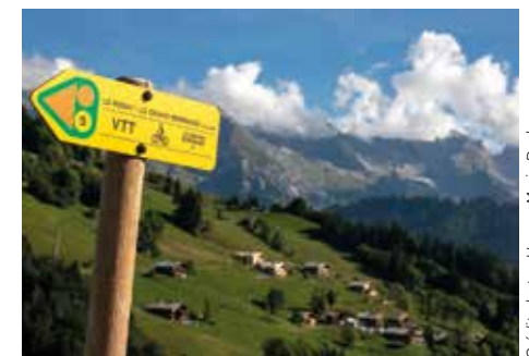
Plan tourisme quatre saisons en Haute-Savoie (74)